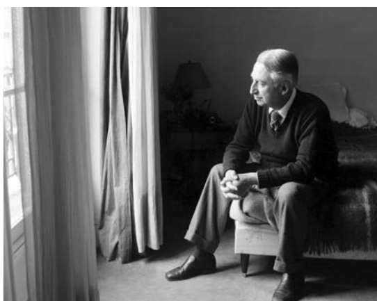
Roland Barthes à Paris, le 25 avril 1979

Pour moi, il ne s'agit pas de pirouettes. Les éléments de théories linguistiques qui jalonnent mon livre ne sont jamais là juste pour décorer, ils constituent des moteurs essentiels du récit : la sémiologie, les fonctions du langage, le performatif... J'ai voulu faire un roman sur la rhétorique, et voir si on pouvait transformer des concepts linguistiques en enjeux romanesques.