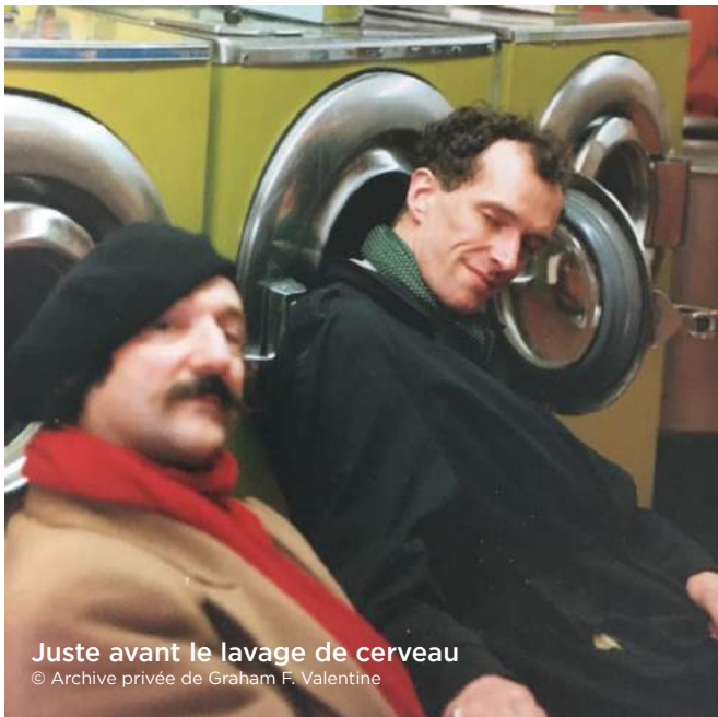
Juste avant le lavage de cerveau