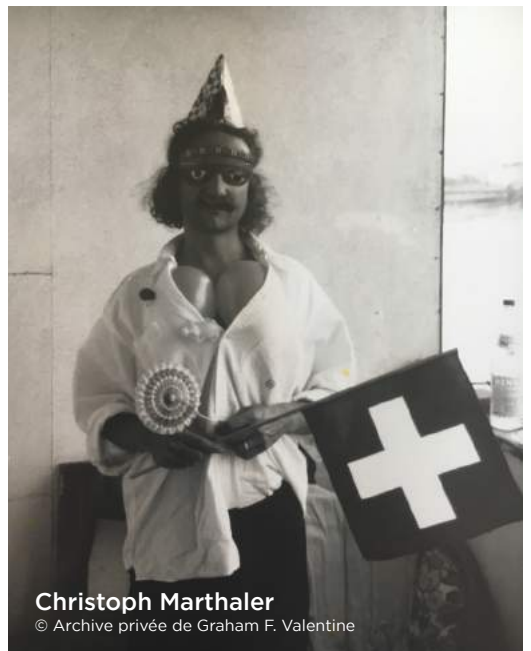
Christoph Marthaler