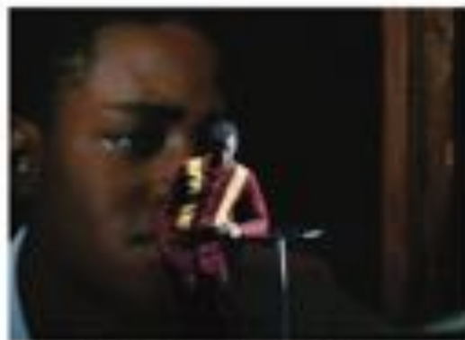
Elise Vigier et James Baldwin lors de la répétition de «Harlem Quartet» à Créteil.

«Une femme retrouvée pleure dans une mare de sang [...] une tempête, une violence, un prodige de sang : un sang, le sang de mon frère, le sang de mon frère / Mon sang = l'âme de Montezuma, l'air amer, l'air vif, l'air vif, l'air vif, l'air vif, à 20 ans. Ce redoublé d'histoire de groupe avec le récit d'un homme et le récit d'un monde entier s'est écrit au rythme d'un chant