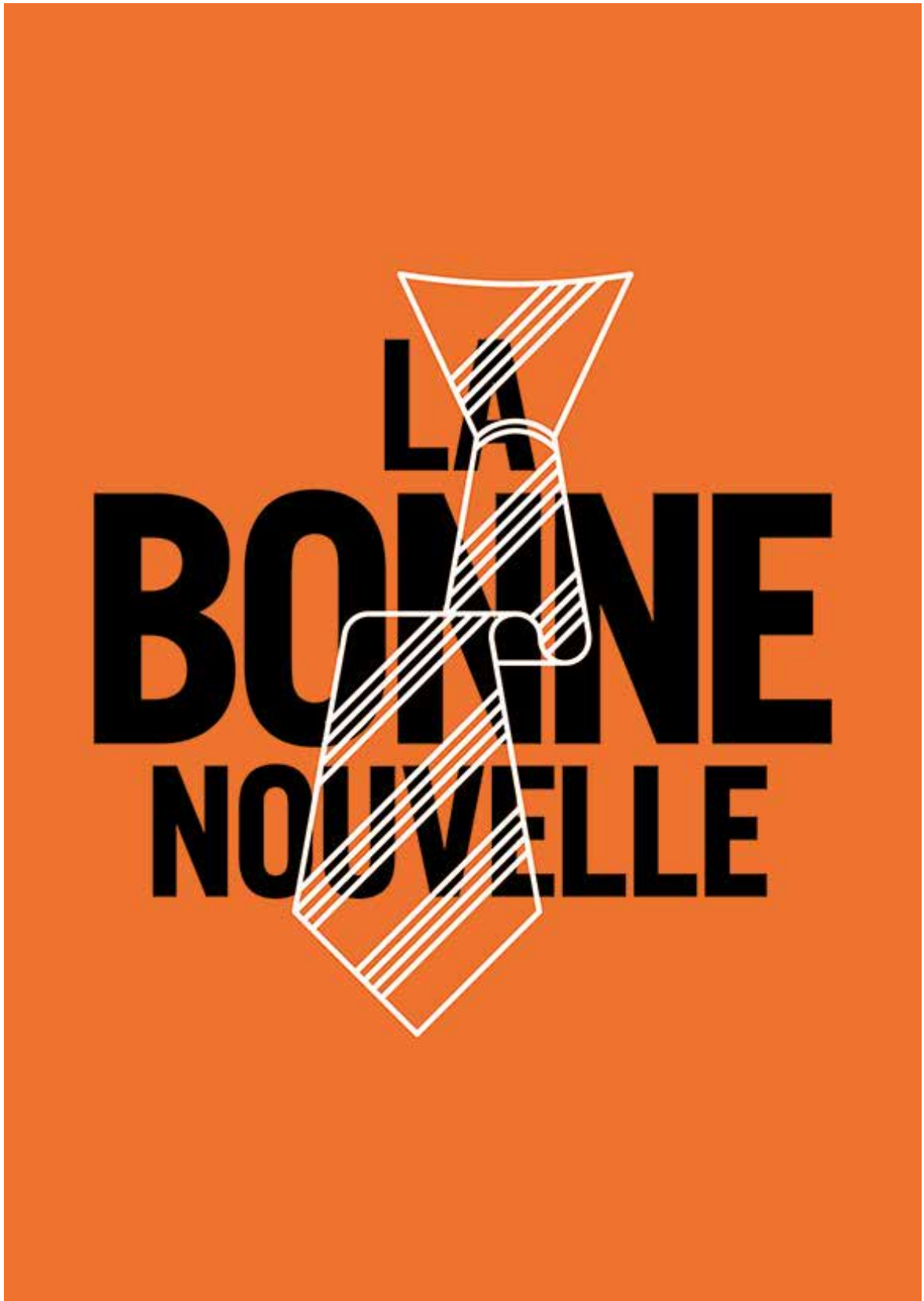
L’affiche du spectacle pour la création au TDB-CDN (Théâtre Dijon Bourgogne, Centre dramatique national)