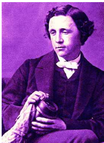
Lewis Carroll

L'oeuvre de Lewis Carroll a tout pour plaire au lecteur actuel : des livres pour enfants, de préférence pour petites filles ; des mots splendides, ésotériques ; des grilles, des codes et décodages ; des dessins et photos ; un contenu psychanalytique profond, un formalisme logique et linguistique exemplaire. Et par de là le plaisir actuel, quelque chose d'autre, un jeu du sens et du non-sens, un chaos-cosmos... La place privilégiée de Lewis Carroll vient de ce qu'il fait le premier grand compte, la première grande mise en scène, des paradoxes du sens, tantôt les recueillant, tantôt les renouvelant, tantôt les inventant, tantôt les préparant.