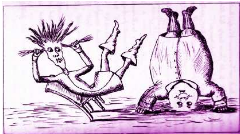
Lewis Carroll ©