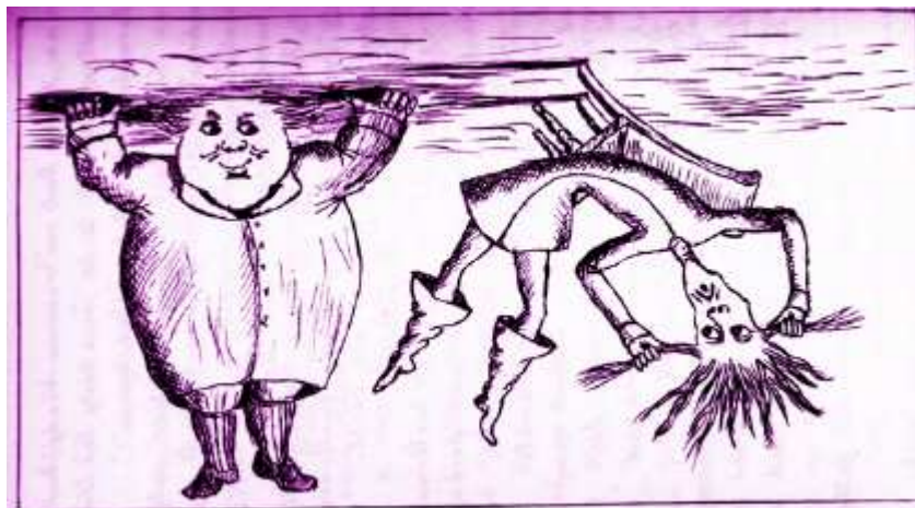
Lewis Carroll ©